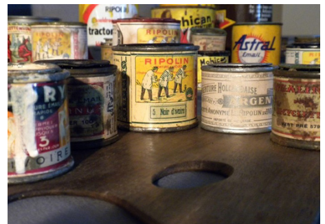
Pots, collection de l'AIC

Le CICRP organise avec l'Art Institute de Chicago et le Musée Picasso d'Antibes, un symposium intitulé "From Can to Canvas, Premières utilisations des peintures industrielles par Pablo Picasso et ses contemporains dans la première moitié du XXème siècle". Les journées des 25 et 26 mai 2011 se dérouleront à Marseille, la journée du 27 mai 2011 aura lieu dans les locaux du Musée Picasso d'Antibes. Un site dédié à l'événement est en ligne présentant les objectifs du symposium, les modalités d'inscription etc. : www.fromcantocanvas.fr .