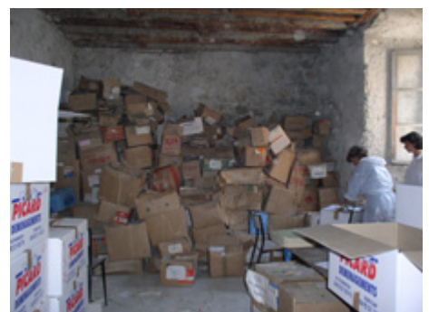
Reconditionnement avant stockage en un lieu mieux approprié, couvent des Récollets, Briançon

Face à ces "grands et petits dégâts", le CICRP souhaite être un recours de proximité et de 1er niveau d'intervention pour des lieux patrimoniaux afin de mettre en place ou à leur disposition quelques moyens, en attendant la prise de relais de conservateurs-restaurateurs, qui peut, pour des raisons matérielles ou de procédure, prendre un peu de temps.