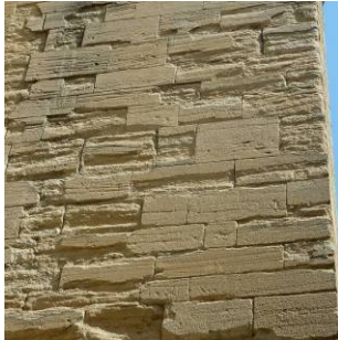
Ci-contre : Desquamation en plaque de la pierre sur l'ancienne cathédrale de Carpentras, en pierre de Caromb