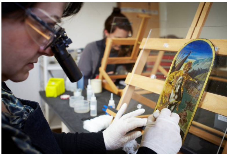
Peinture sous verre en cours de restauration