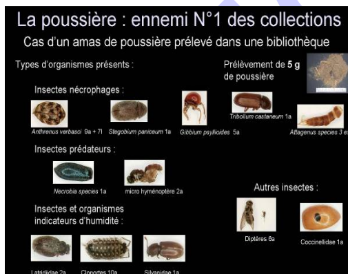
Support pédagogique (Fabien Fohrer)

Cette formation, tant théorique que pratique, dispensée par Fabien Fohrer se déroule sur une semaine (26 au 30 novembre 2012).