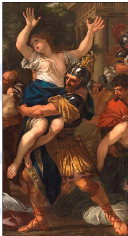
Louis Chaix, L'Enlèvement des Sabines , (détail), Musée Borely, Marseille.

Je vous invite à prendre plus amplement connaissance de ces deux projets dans les lignes qui suivent et espère que vous aurez plaisir à y participer.